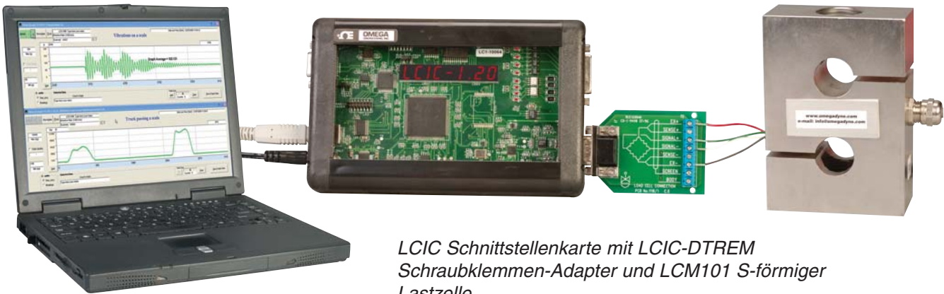
LCIC Schnittstellenkarte mit LCIC-DTREM Schraubklemmen-Adapter und LCM101 S-förmiger Lastzelle

Neben Zoom- und Min-/Max-Funktionen bietet die Software auch Berechnungsfunktionen wie die Mittelwertbildung über einen gewählten Ausschnitt der Kurve oder den Export als ASCII-Datei.