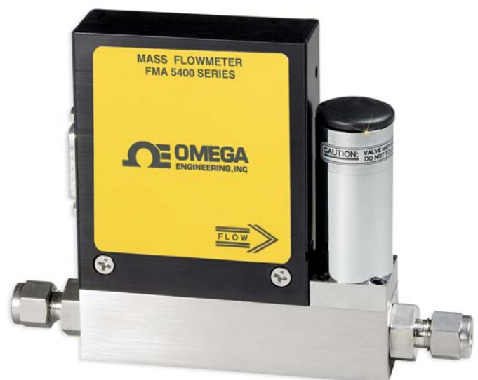
Ausführung ohne Anzeige

Bestellbeispiele: FMA5410-ARGON, 13,8/10,4 bar, 25°C ist ein Massendurchflussregler ohne integrierte Anzeige, kalibriert für Argon mit einem Einlassdruck von 13,8 bar und einem Auslassdruck von 10,4 bar, einer Gastemperatur von 25°C und einer Spannungsversorgung von 12 V DC. FMA5516, Stickstoffregler mit Anzeige und FMA545PW-220V-AC, Spannungsversorgung.