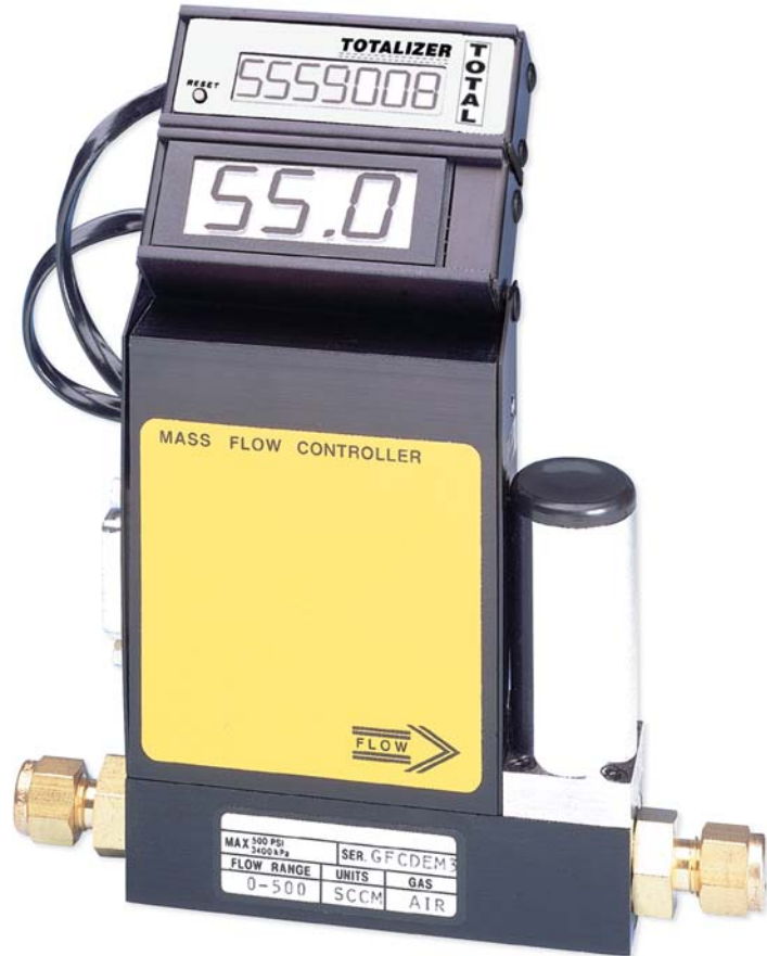
FMA5544 mit optionalem Summierer FMA-Total-(44)

Die elektronischen Gas-Massendurchflussregler der Serie FMA5400/5500 messen und regeln den Durchfluss verschiedener Gase von 10 sml/min bis zu 1000 sl/min. Der FMA5400/5500 misst den Gasdurchfluss über den Wärmetransfer an einem beheizten Messrohr. Bei diesem Verfahren ist (innerhalb der spezifizierten Grenzen) keine Kompensation von Gasdruck oder -temperatur erforderlich. Für viele inerte Gase lässt sich die preiswertere Ausführung aus Aluminium und Messing lieferbar, bei Bedarf kann auch eine korrosionsbeständigere Ausführung aus 316SS eingesetzt werden. FMA5400-Modelle ohne integrierte Anzeige verfügen über einen einstellbaren Analogausgang (0 bis 5 V DC oder 0/4 bis 20 mA). Die FMA5500-Serie ist zusätzlich mit einer integrierten 3-1/2-stelligen Anzeige ausgestattet. Die Anzeige kann um 90 Grad gekippt werden.