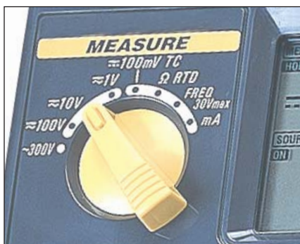
Drehescher - Messen