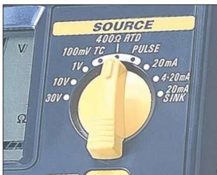
Drehescher - Geben