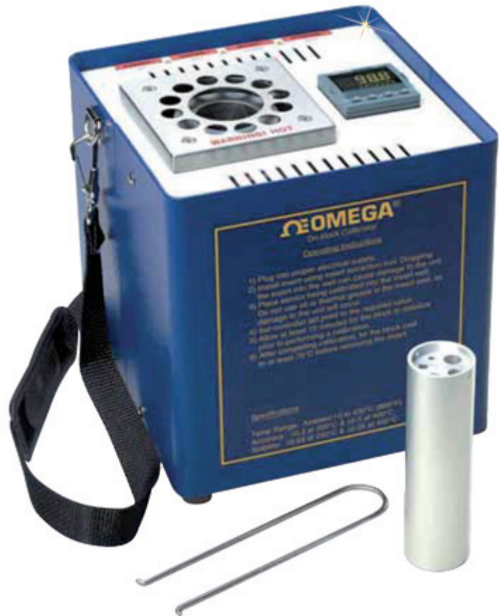
CL-355A mit Demontagezange für Einsätze und Mehrloch-Einsatz

Dieser Kalibrator ist für eine Umgebung mit 5 bis 40°C, bis zu 95% relative Feuchte ausgelegt.