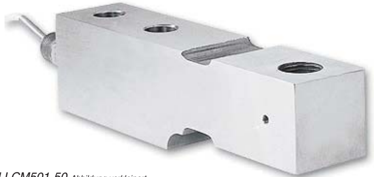
Modell LCM501-50 Abbildung verkleinert

PT06F-10-6S (nicht im Lieferumfang enthalten)